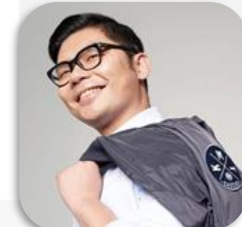
許毓仁 TED x Taipei共同創辦人 哈佛大學甘迺迪學院訪問學者