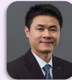
黃蜂麟 F.L. AI應用開發 行銷科技