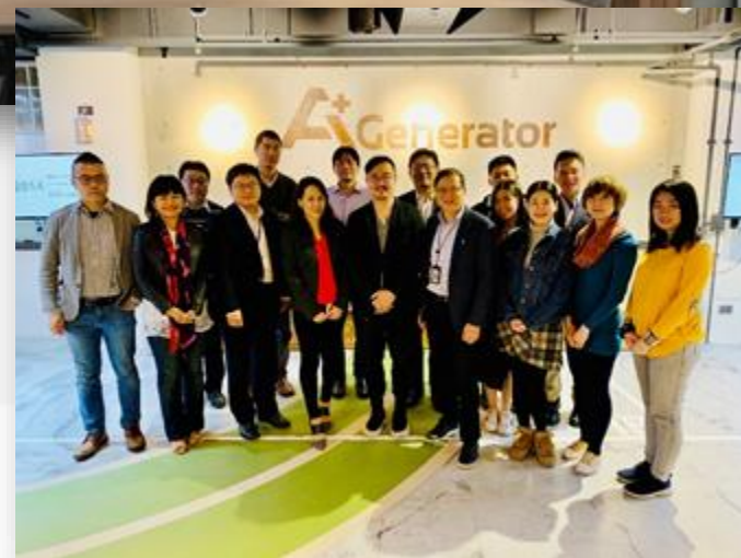
AI+ GENERATOR SPACE